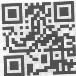
Презентация «Перелетные птицы»

на неопределенный срок. Особенно актуально выполнение заданий, когда ребенок болеет и не может посещать детский сад.