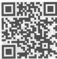
Пальчиковая гимнастика «Перелетные птицы»